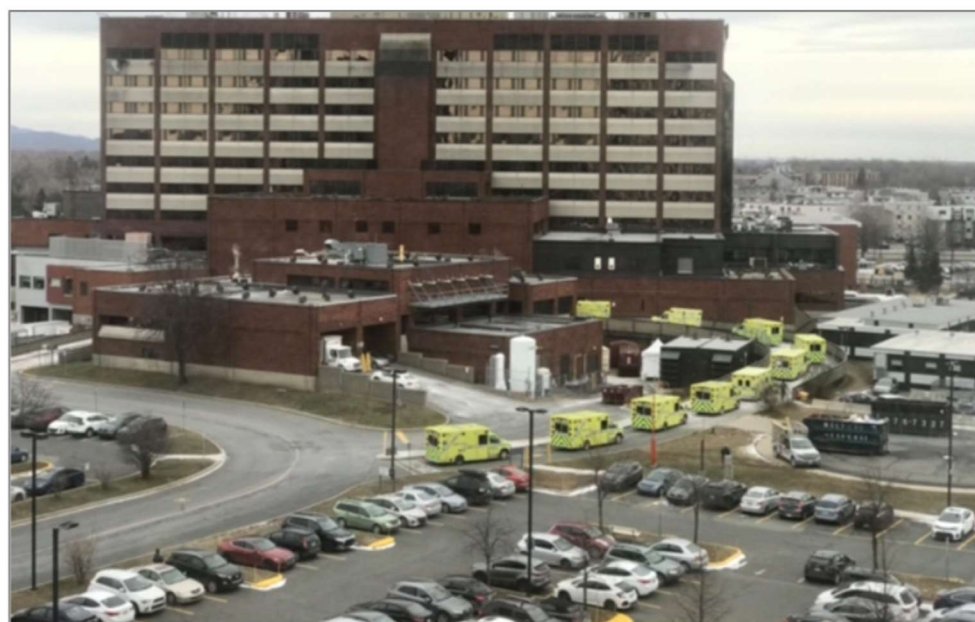
Illustration de la nécessité de transformer le système